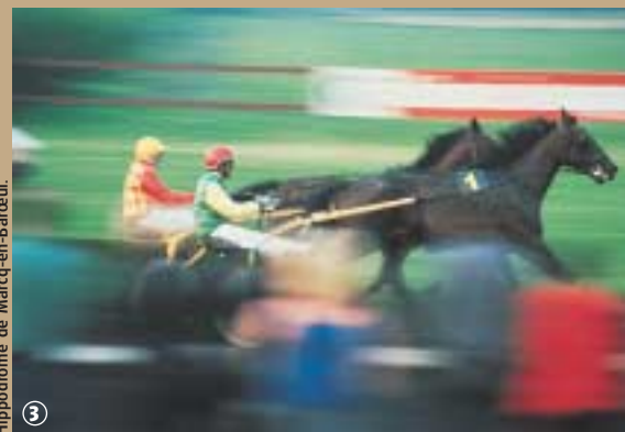
Hippodrome de Marcq-en-Barœul.

De plus, un éclairage des pistes permet désormais une programmation des courses en nocturne. Mais ce lieu n'est pas seulement le point de rencontres des turfistes et amateurs de chevaux. Fort de ces 30 ha de verdure, le champ de courses abrite également un golf, des carrières de saut d'obstacles, des terrains de sport, des salles de