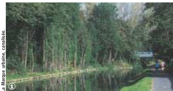
La Marque urbaine, canalisée.