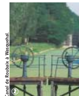
Canal de Roubaix à Wasquehal.