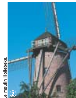
Le moulin Hollebeke.