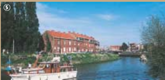
Tourisme fluvial sur la Lys.

port de plaisance, aménagé sur la partie « morte » de la Lys. Les nombreux badauds peuvent se laisser séduire par la quiétude du lieu, installés en terrasse. La mairie envisage, dans le cadre du développement touristique de la Métropole lilloise dans la vallée de la Lys, d'agrandir le port de plaisance et les espaces verts et d'installer une passerelle sur l'ancienne écluse reliant directement le port à la Belgique et vice versa. Qui a dit que la Métropole lilloise n'était pas verdoyante ?