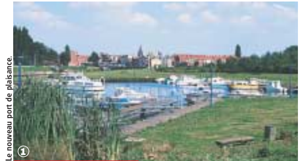
Le nouveau port de plaisance.

Randonnée Pédestre Du Kluit Put à la Lys : 12,5 km