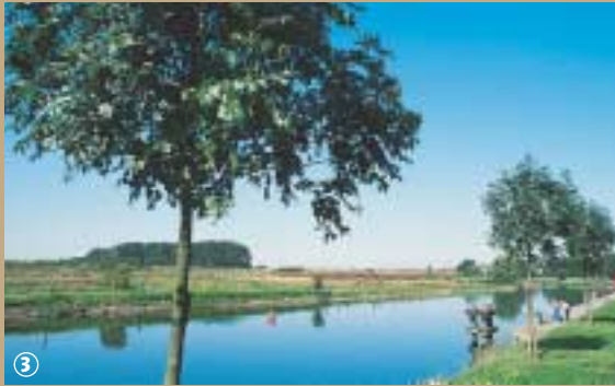
Canal de la Lys.

englobe un étang de pêche et un bois de 5 ha. La promenade mène ensuite au Kluit Put, la terre d'argile. Cette ancienne carrière aujourd'hui réhabilitée, tend à préserver la nature sous son aspect sauvage ; les sportifs peuvent s'exercer sur les seize ateliers du parcours de santé. D'un intérêt pédagogique, la ferme du Mont, construite en 1914, veut faire connaître la ruralité aux citadins, par des initiations à l'environnement. Le clou de la balade est le