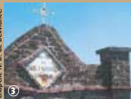
Chapelle N.-D. de Délivrance.

Linselles est une ville qui témoigne à chaque coin de rue ou presque de sa foi en Dieu. On dénombre sur la commune, en plus de l'église du centre ville, sept chapelles, quatre calvaires et une trentaine de niches. Serions-nous à Linselles plus croyants qu'ailleurs ?