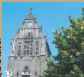
Eglise de Linselles.

quartier de la ville. Le quartier Blaton, en lieu et place d'une ancienne brasserie, se remarque par sa chapelle dédiée à Saint Roch, qui protégeait du choléra, une statue de Saint Joseph, une Vierge et un remarquable motif de fer forgé de 1782. Le quartier du Gâvre est surnommé « terre sainte du Gâvre » à cause des nombreuses statues de saints qui peuplent les niches. La rue des Chaudronniers vaut le détour car c'est la plus ancienne de Linselles ;