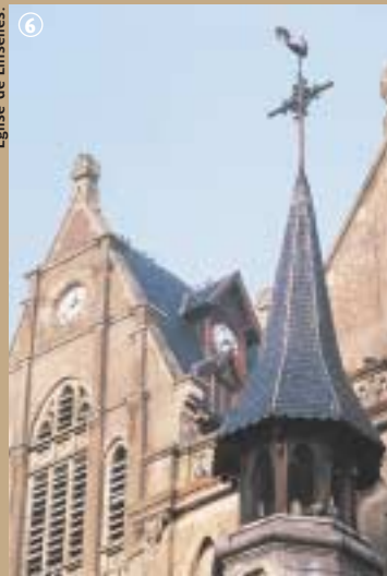
Eglise de Linselles.