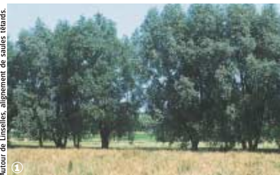
Autour de Linselles, alignement de saules rétrods.

Randonnée Pédestre Chapelles et Censes de Linselles : 5 km ou 8 km