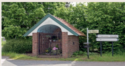
Le château d'eau de Wattrelos et la chapelle Notre - Dame de la délivrance