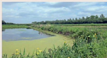
Le pont du grimonpont et les bassins filtrants de Leers