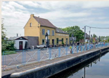
Le canal de l'Esperres - Leers